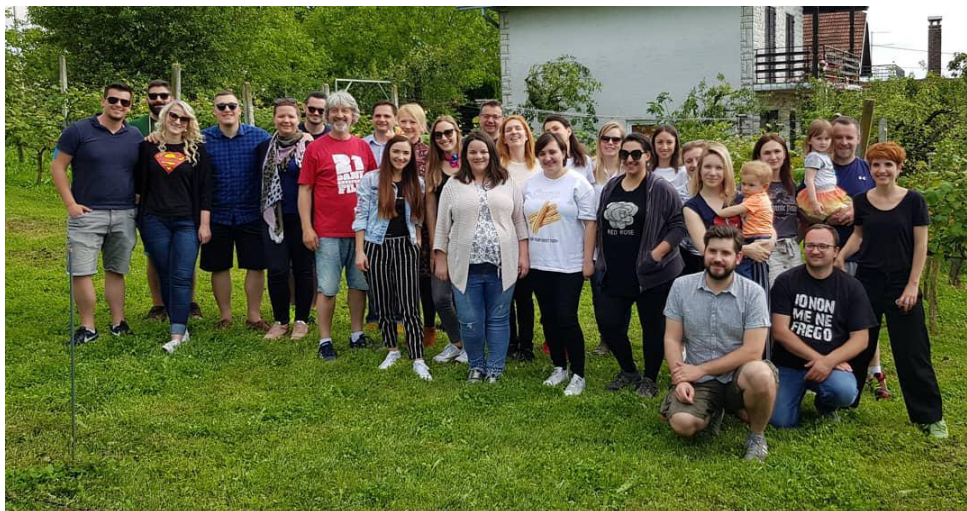
9. tradicionalno druženje članova DKMK-a i njihovih prijatelja i partnera