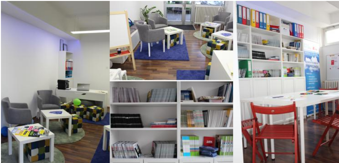
Dani otvorenih vrata udruga

DKMK je i 2019. godine sudjelovao u „Danima otvorenih vrata udruga“ i 16. svibnja otvorio vrata svog novog ureda u Golikovoj 28 za sve zainteresirane posjetitelje.