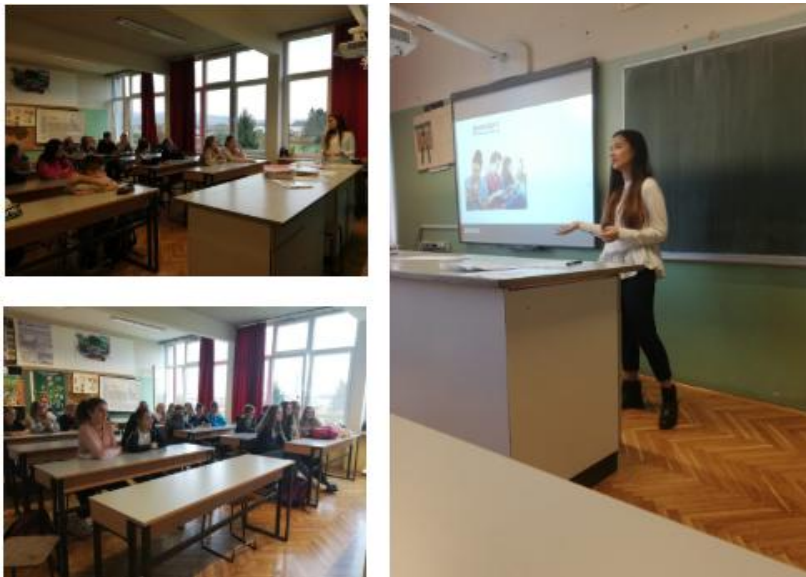
OŠ Veliko Trgovišće

Do sad smo u sklopu projekta održali predavanja u ruralnim sredinama koje su često izuzete iz raznih aktivnosti, pa smo tako posjetili osnovne škole Veliko Trgovišće, Karlobag, Driš i Salinovec.