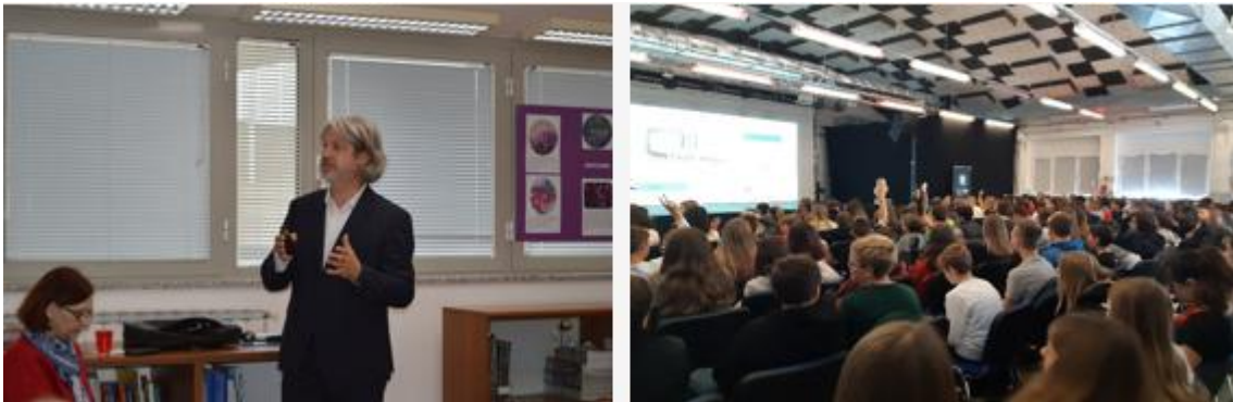
Predavanja u OŠ Izidora Poljaka u Donjoj Višnjici i samoborskom Bunkeru