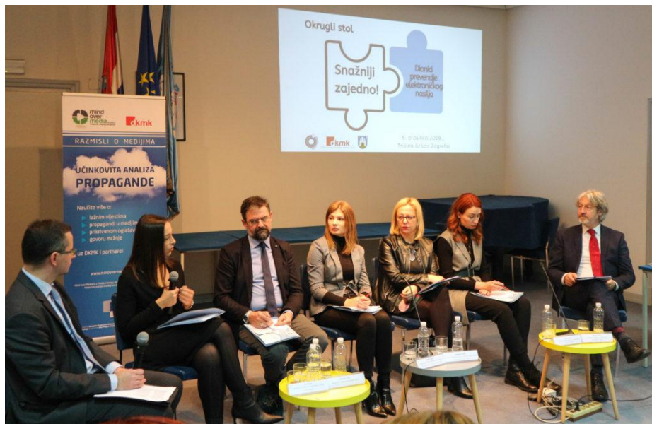
Okrugli stol „Snažniji zajedno! Dionici prevencije elektroničkog nasilja“