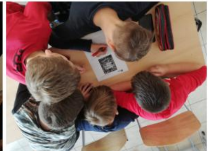
Radovi učenika OŠ Vukovina