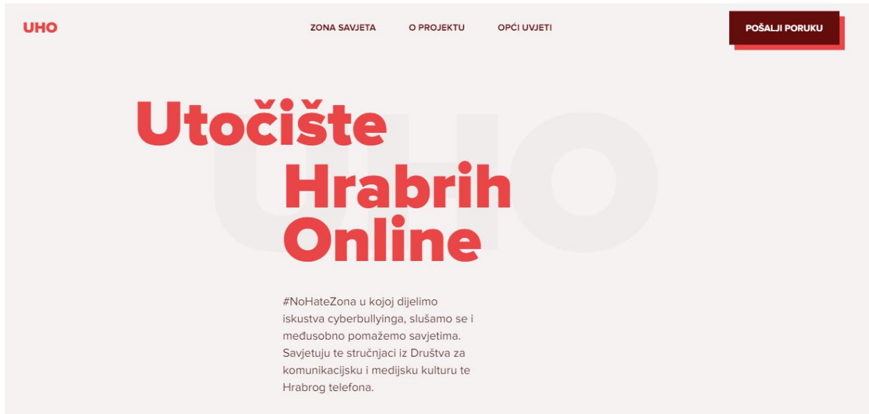
Početna stranica platforme UHO