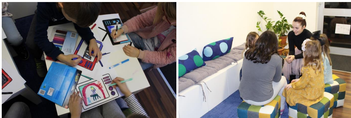
Slika 4. i 5. Radionice medijske pismenosti za djecu predškolske dobi

Svime navedenim obuhvatili smo preko 300 izravnih sudionika – djece od 5 do 14 godina.