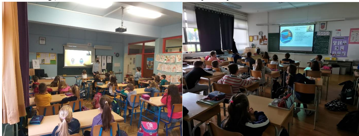
Slika 8. i 9. Video predavanja za učenike OŠ Josipa Račića, Zagreb

Također, vrlo je važno što su djeca naučila prepoznati prednosti i prijetnje koje donosi korištenje novih medija; da su naučila primijeniti načine zaštite na internetu i društvenim mrežama, osobito na društvenim mrežama i komunikacijskim kanalima koje najčešće koriste (Viber, Snapchat, Instagram, Tik Tok i drugi), te da su naučila kome se obratiti u slučaju zloupotrebe.