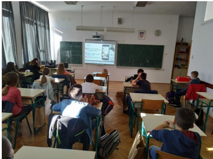
Slika 1. OŠ Stjepana Radića Metković