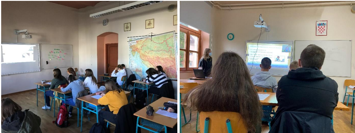
Slika 6. i 7. Srednja škola Prelog

U sklopu projekta #stop(e)nasilju tako smo obuhvatili ukupno 308 učenika te 193 učitelja, stručna suradnika i roditelja , to jest ukupno 501 sudionika .