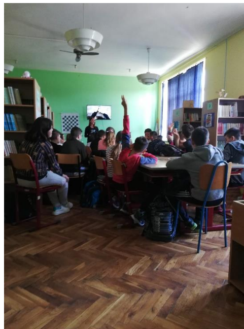
Slika 2. OŠ Grigora Viteza Poljana