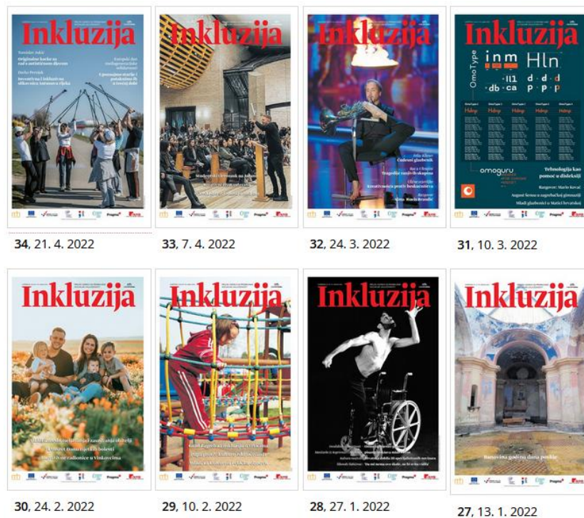
Slika 6. Neka od izdanja „Inkluzije“

Cilj projekta bio je unaprjeđenje kvalitete medijskog izvještavanja o ranjivim skupinama edukacijom novinara i proizvodnjom medijskih sadržaja s naglaskom na socijalnu uključenost kroz kulturu. U sklopu projekta izlazio je redoviti prilog dvotjednika Vijenac pod naslovom Inkluzija u sklopu kojega smo tijekom 24 mjeseca objavili ukupno 1320 kartica teksta. Održano je 12 radionica i webinarâ za 20 novinara te je izdan priručnik „Izvješćivanje o ranjivim skupinama“.