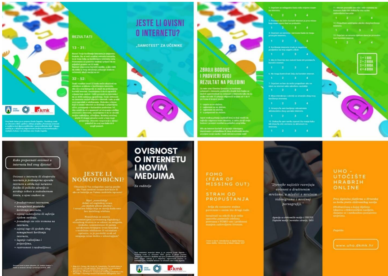
Slika 3. Preklopnici „Ovisnost o internetu i novim medijima“ i „Jeste li ovisni o internetu?“