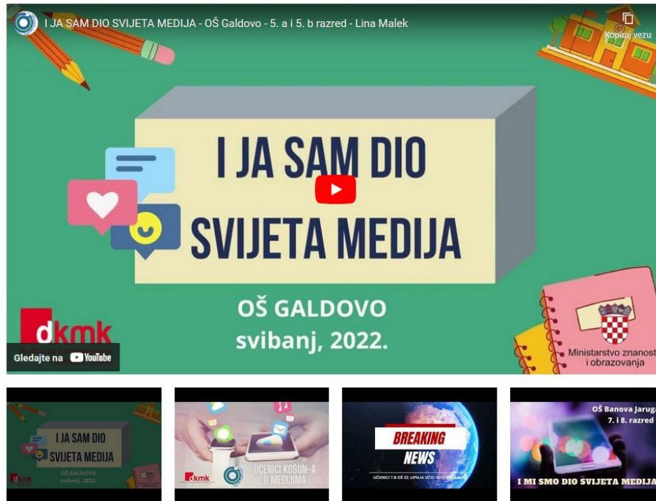
Slika 3. Video uradci učenika sudionika projekta „I ja sam dio svijeta medija“

Opći cilj provedbe edukacija u partnerstvu sa školama i vrtićima bio je odgovoriti na rastuću potrebu za medijskim odgojem i osnaživanjem medijske, digitalne i emocionalne pismenosti koje nisu obuhvaćene odgojno-obrazovnim programom. Ovaj cilj svakako smo ostvarili suradnjom sa školama i vrtićima Sisačko-moslavačke županije koji su pokazali veliki interes za našim edukacijama, a u evaluacijama smo dobili komentare poput „Webinar se bavi aktualnom temom koja nas okružuje i oko koje nam je svakako potrebna pomoć stručnjaka“ i „Nadam se da će se medijski odgoj uvrstiti u naš obrazovni sustav, prijeko je potreban našoj djeci i mladima! Hvala, bilo je korisno i poticajno!“.