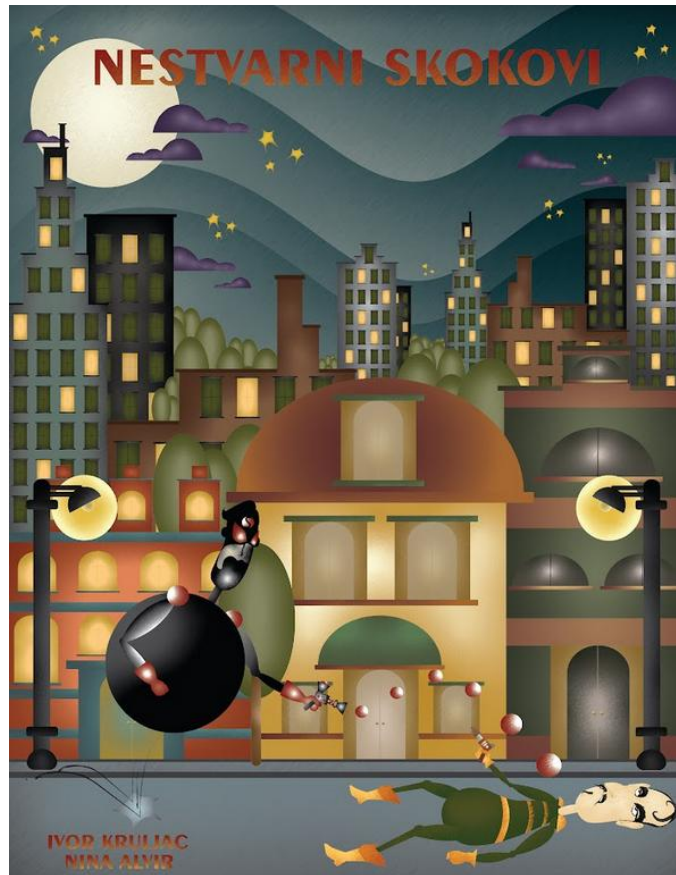
Slika 5. Naslovnica slikovnica „Nestvarni skokovi“