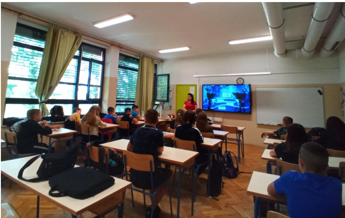
Slika 1. Predavanje koordinatorice „Jesmo li stvarno onakvi kakvi smo virtualno?“ u OŠ Vukovina

pandemije. Zahvaljujući snimljenim predavanjima, projekt je dosegao puno veći broj korisnika od očekivanog. Naime, matične su osnovne škole provodile naša video predavanja po svim razrednim odjeljenjima, kao i po područnim školama, što je rezultiralo s ukupno 47 razrednih odjeljenja do kraja druge godine projekta. U nekim se velikogoričkim osnovnim školama i u ovoj školskoj godini još uvijek prikazuju novim generacijama. Dok smo predavanjima uživo obuhvatili ukupno 117 učenika, video predavanjima smo dosegli ukupno 672 učenika. Stoga je ukupno 789 učenika velikogoričkih osnovnih škola sudjelovalo na edukacijama u sklopu druge godine provedbe ovog projekta.