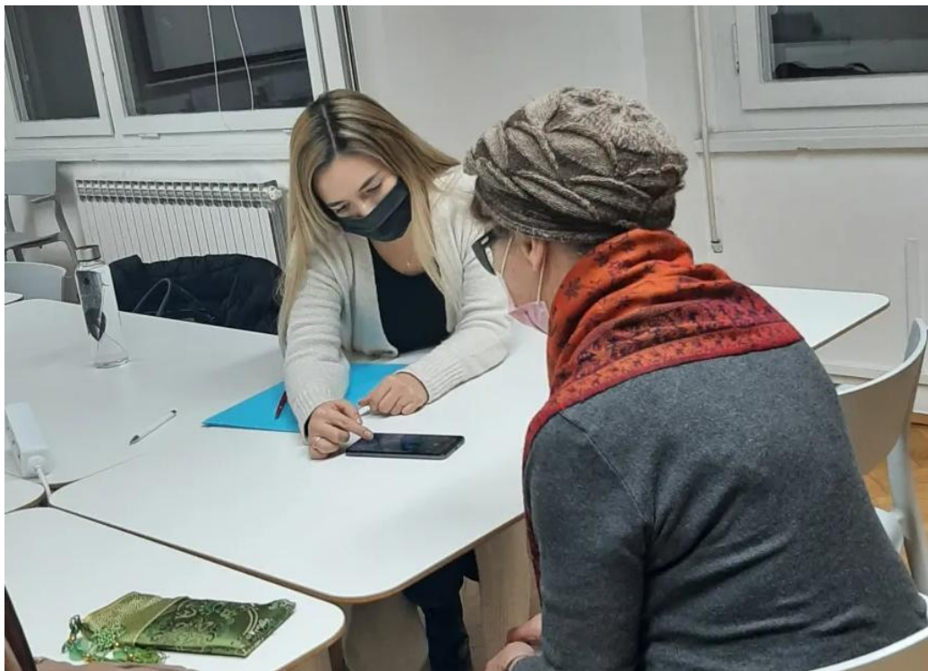
Slika 4. Predavačica s umirovljenicom u Zakladi „Zajednički put“

Štoviše, ukazali smo im koliko novi digitalni mediji utječu na njihovu komunikaciju i jesu li se pravila ponašanja i bonton, zbog novih medija i u njima, doista promijenili.