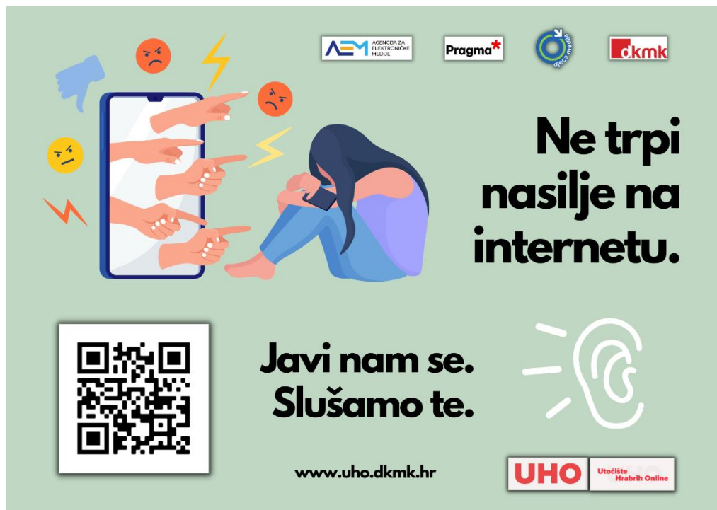
Slika 4. Plakat za škole „Ne trpi nasilje na internetu“